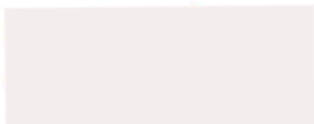
Dodávateľ : Ľubomír Gancarčík konateľ spoločnosti